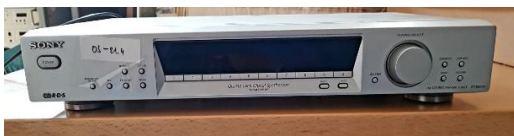
Sl. 15) FM/AM tuner