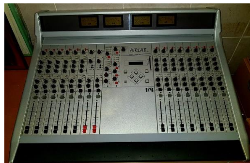
Sl. 8) Audio mikseta 16CH