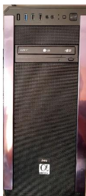
Sl. 38) PC računalo I5