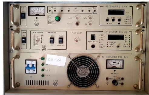
Sl. 4) FM odašiljački sustav 300FM