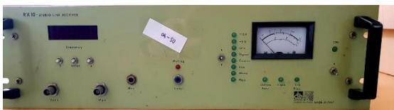
Sl. 7) Prijemni link