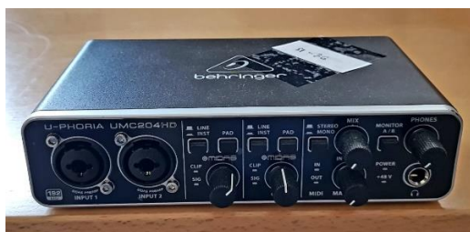
Sl. 24) USB-ZV kartica