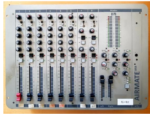
Sl. 10) Audio mikseta USB