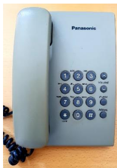
Sl. 20) Telefon Panasonic