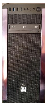
Sl. 36) PC računalo I3