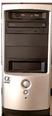
Sl. 37) PC računalo Celeron