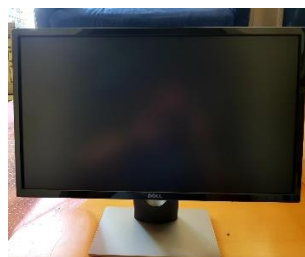
Sl. 30) Monitor 24" Dell