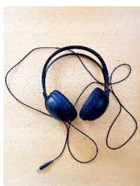
Sl. 29) Slušalice Philips