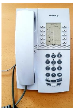
Sl. 21) ISDN telefon