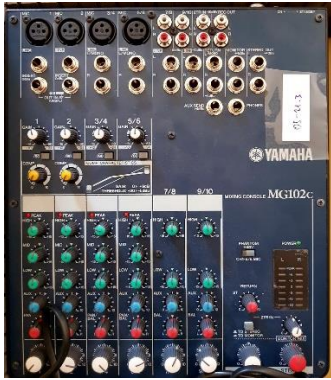
Sl. 9) Audio mikseta mini

Predmet: Procjena vrijednosti opreme za produkciju i prijenos radio signala Naručitelj: RADIO VARAŽDIN d.o.o. u stečaju Varaždin Datum: Rujan 2019.