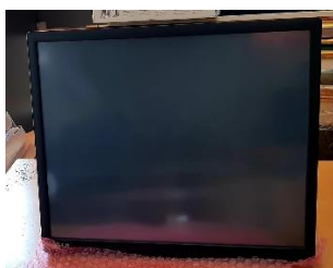
Sl. 31) Monitor touchscreen 19"