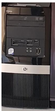
Sl. 39) PC računalo Compaq