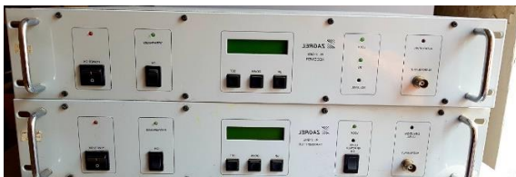
Sl. 5) Prijemno predajni link Zagrel