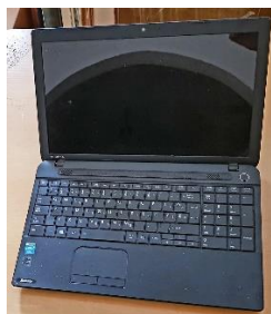
Sl. 34) Prijenosno računalo Toshiba