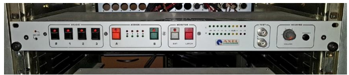
Sl. 12) Matrix switcher