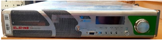
Sl. 1) FM odašiljač