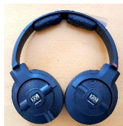
Sl. 28) Slušalice Krk