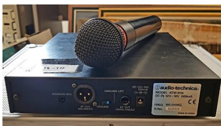
Sl. 27) Mikrofon bežični