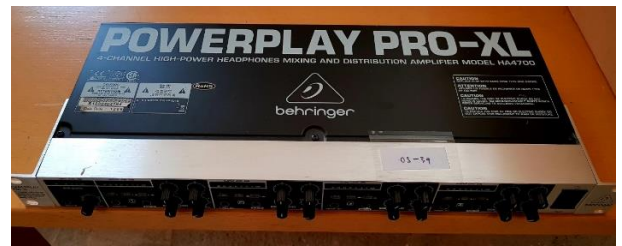
Sl. 16) Studijsko pojačanje za slušalice