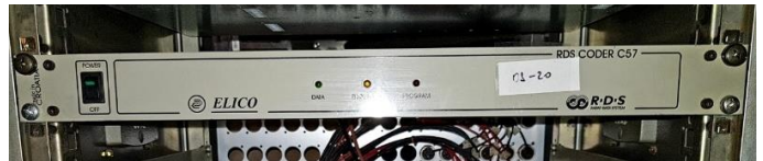
Sl. 14) Digitalni RDS coder