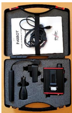
Sl. 23) GSM interface