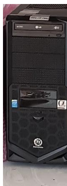
Sl. 40) PC server s fonotekom