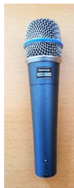
Sl. 26) Mikrofon Sure beta 57A