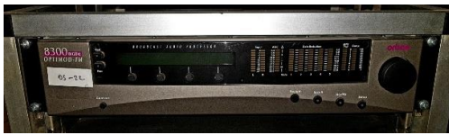
Sl. 11) Audio procesor Orban