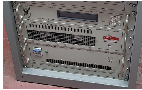
Sl. 2) FM odašiljački sustav FM30