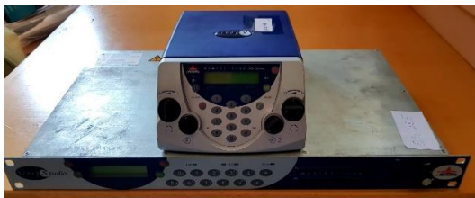
Sl. 17) ISDN komplet

Predmet: Procjena vrijednosti opreme za produkciju i prijenos radio signala Naručitelj: RADIO VARAŽDIN d.o.o. u stečaju Varaždin Datum: Rujan 2019.