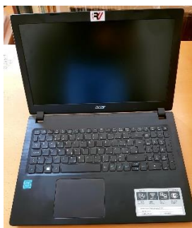
Sl. 35) Prijenosno računalo Acer