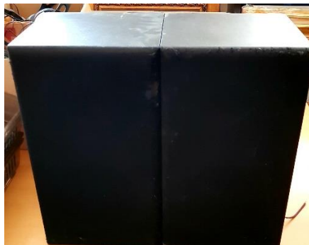
Sl. 18) Zvučne kutije