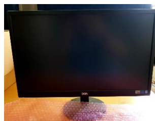
Sl. 32) Monitor 21,5" Aoc