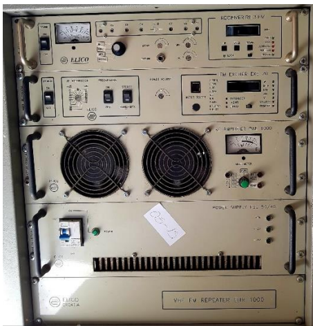
Sl. 3) FM odašiljački sustav EXE20