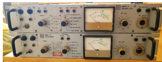
Sl. 6) Prijemno predajni link Ieta